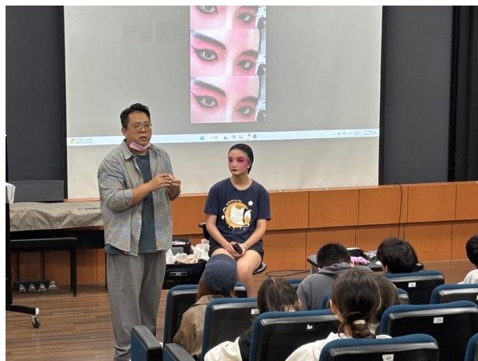
介紹眼部妝容與特色