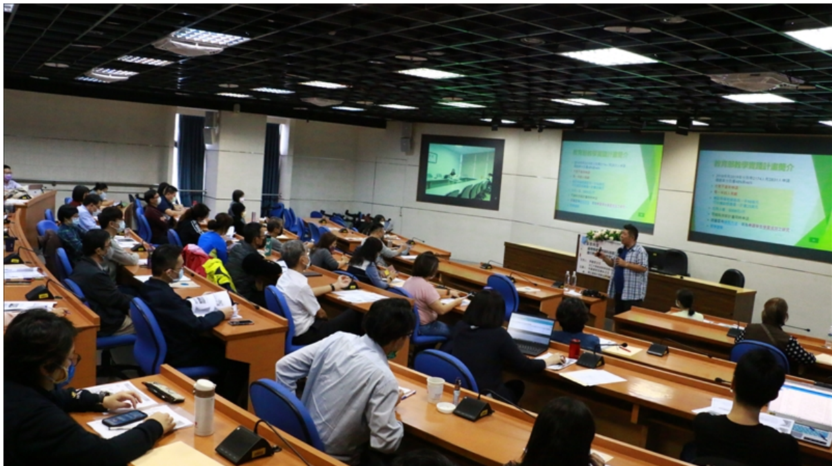
參與老師們專注聆聽